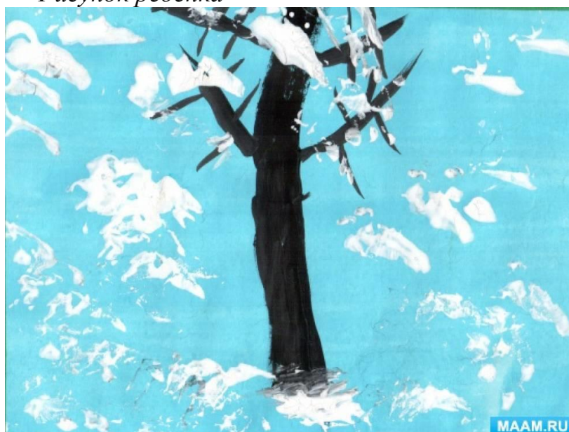
Образец с частичным изображением дерева (ствол)