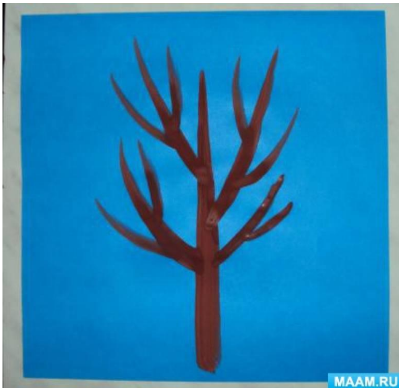
Показ изображения снега жатой бумагой